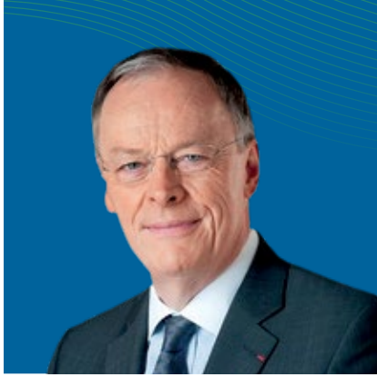
السيد/ فينسنت دي ريفاز عضو مجلس الإدارة

شغل السيد/ فينسنت دي ريفاز منصب الرئيس التنفيذي لطول مدة في شركات الطاقة في المملكة المتحدة، وذلك بين فبراير ٢٠٠٢ وأكتوبر ٢٠١٧. كما تولى مجموعة واسعة من المسؤوليات في مجموعة "إي دي اف" (الشركة الفرنسية للكهرباء) وشغل عضوية اللجنة التنفيذية من عام ٢٠١٠ حتى عام ٢٠١٧ قبل أن يتقاعد من المجموعة في عام ٢٠١٨. وخلال ما يقرب من عقد من الزمان، قاد الحوار مع حكومة المملكة المتحدة ومجموعة واسعة من الأطراف المعنية ليجاد الظروف السياسية والمالية والصناعية والتنظيمية المناسبة لإحياء صناعة الطاقة النووية في المملكة المتحدة. وهو حاصل على شهادة البكالوريوس في الهندسة من كلية غرينوبل الوطنية للهيدروليكا (١٩٧٦) ووسام جوقة الشرف في عام ٢٠٠٩، ووسام الإمبراطورية البريطانية برتبة قائد فخر في عام ٢٠١٢. وتم انتخابه كزميل للأكاديمية الملكية للهندسة في عام ٢٠١٥.